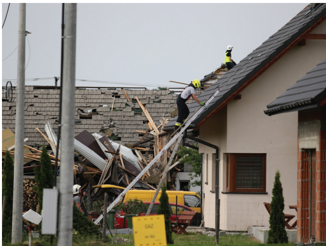
Strażacy pracowali bez przerwy