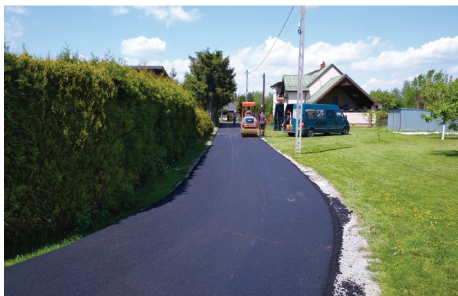
Ul. Ludowa boczna w Kaniowie