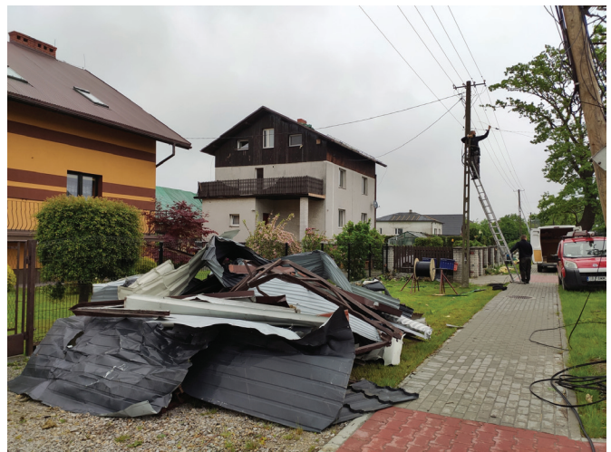
Ul. Dankowicka – usuwanie szkód