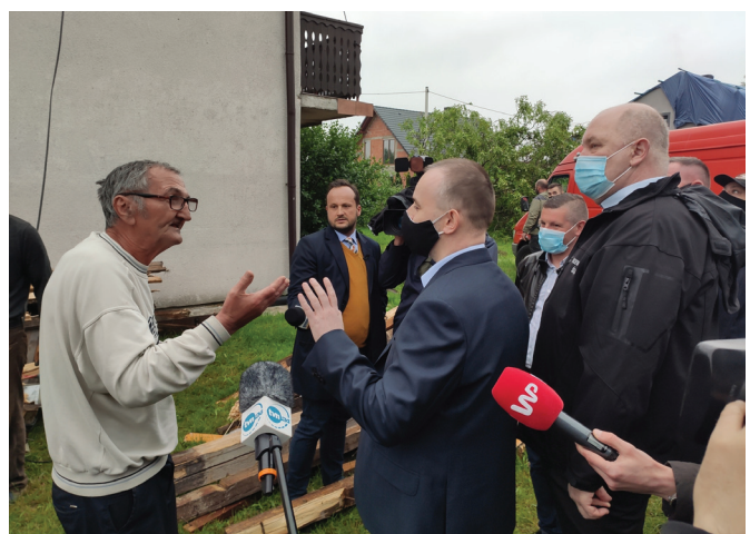
W rozmowie z mieszkańcami