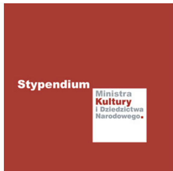
Zrealizowano w ramach stypendium Ministra Kultury i Dziedzictwa Narodowego

– Muszę powiedzieć, iż dzięki wyznaczonym sobie zadaniom związanym z realizacją projektu, przetrwałam ten ciężki okres. Wszystkie prace zostały wykonane ręcznie w kanonie sztuki ludowej za pomocą igły, nitki i tamborka. Praca była bardzo czasochłonna, pozwoliła mi odciąć się od problemów dnia codziennego. Stałam się aktywnym członkiem akcji społecznej „Zostań w domu” – cały czas byłam w domu i haftowałam. Stworzone prace będą ukoronowaniem mojej wieloletniej twórczości ludowej. Jestem wdzięczna Ministerstwu Kultury za dostrzeżenie mojego projektu, który pozwoli mi podziękować mojej Bestwinie, za wrażliwość ludową, którą dała mi ta ziemia.