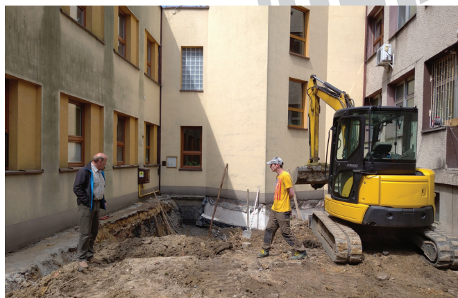
Budowa klubu dziecięcego w Kaniowie