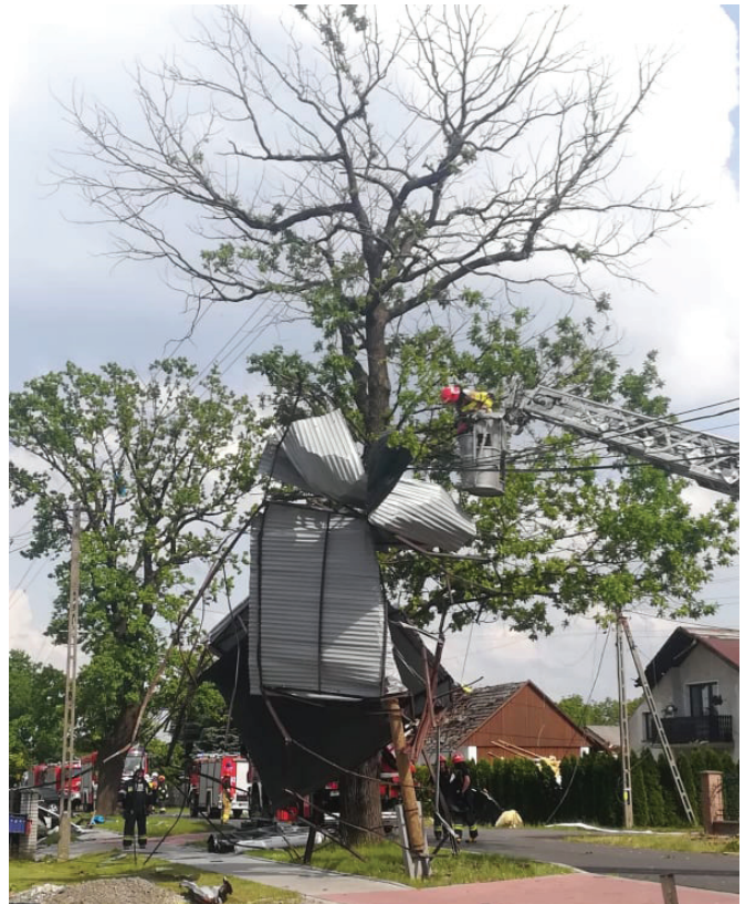
Oplakane skutki kataklizmu