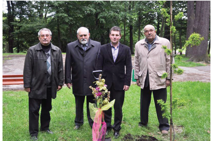
2015 – sadzenie jubileuszowego dębu