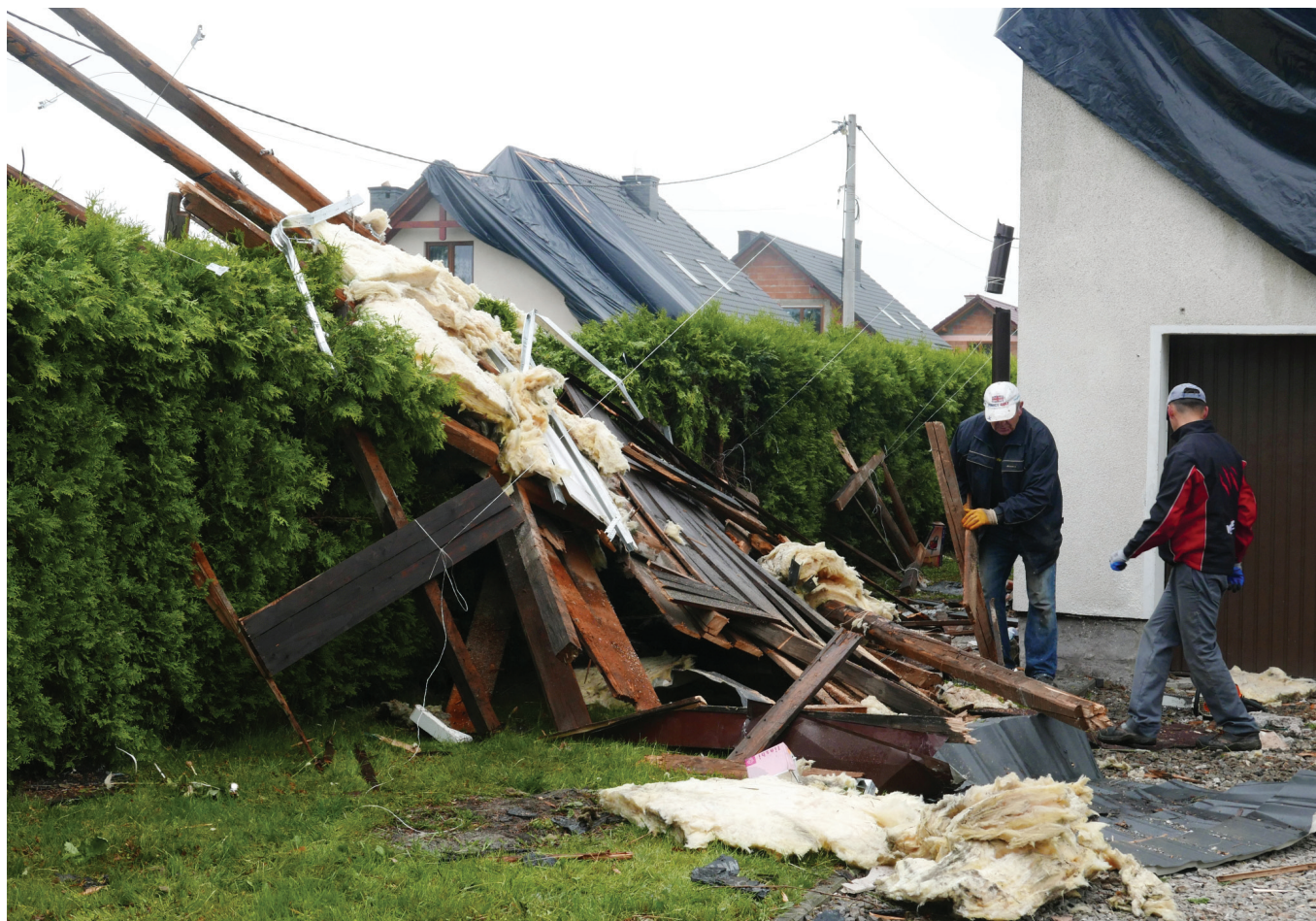
Na ziemi łądowały całe dachy